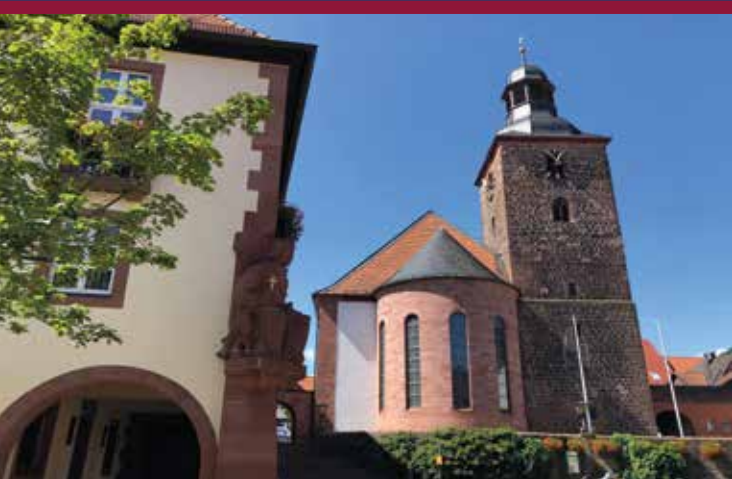
Rathausplatz mit dem ältesten Gebäude der Stadt, der Kirchturm aus dem Jahr 1318

Der Eintritt zu allen Veranstaltungen ist frei! Es ist keine Anmeldung erforderlich.